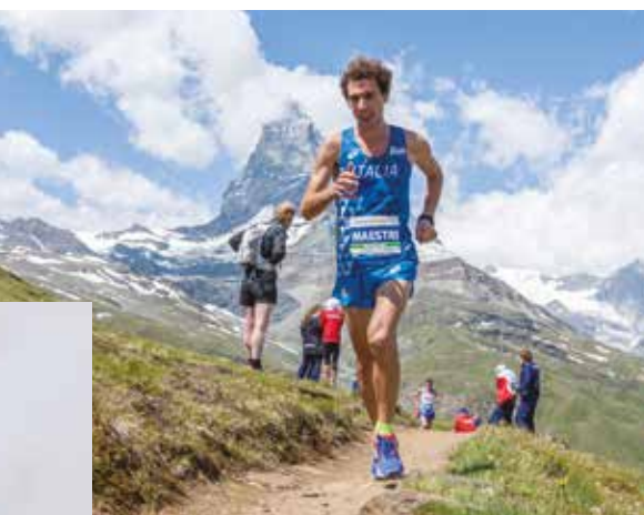
World championships 2017. European championships 2019. During the "Ciaspolada" in Val di Non.