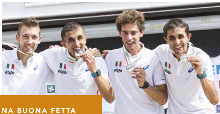
Mondiali 2017. Europei 2019. Alla "Ciaspolada" della val di Non.