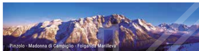
Pinzolo - Madonna di Campiglio - Folgarida Marilleva